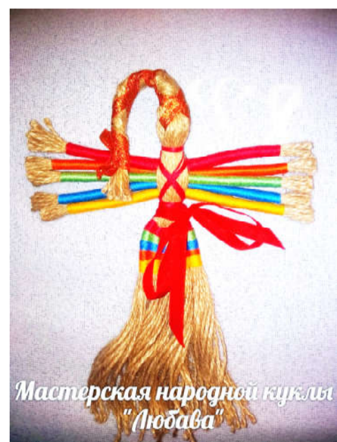
Мастерская народной куклы "Любава"

Режим самоизоляции не стал для работников культуры района бедствием, перечеркнувшим их деятельность. Пожалуй, даже наоборот. Сегодня они имеют возможность охватить значительно большее чис-